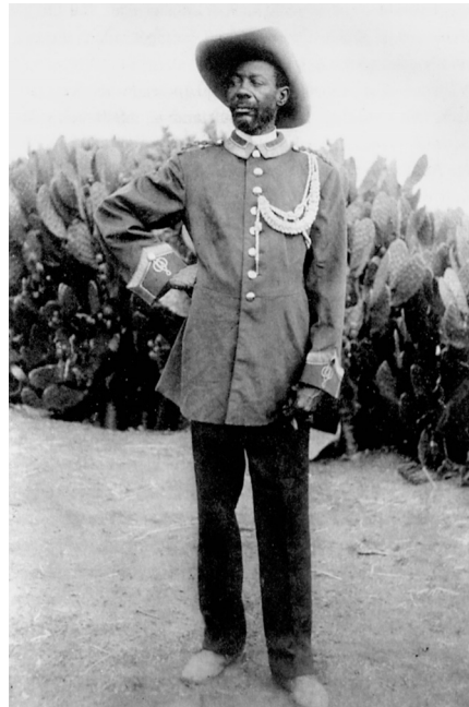
Namalederen Hendrik Witbooi (ca. 1825-1905) (t.v.) og hererolederen Samuel Maherero (1856-1923).