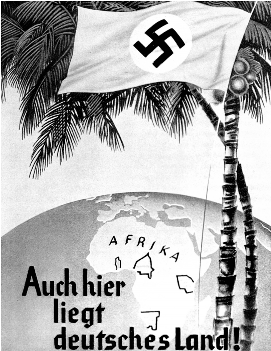
Denne propagandaplakaten fra nazitida minner om at erobring av «tapte» kolonier var en kampsak.