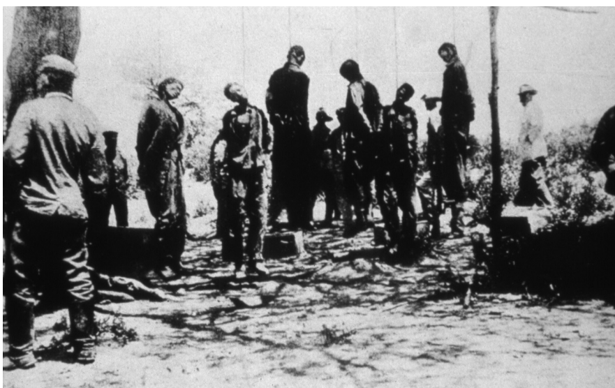
Offentlig henretting av fanger i det sørlige Namibia i 1905/06. En rekke slike bilder ble trykt som postkort.

Når det gjelder namabefolkningen, er det anslått at 40–50 prosent av ca. 20 000 innbyggere i sør mistet livet under krigsåra. 317 I tillegg måtte mange damaraer bøte med livet, ettersom det ikke var så lett for tyskerne å se forskjell på dem og «fiendtlige» grupper. Det er høyst motstridende opplysninger om hvor mange damaraer som ble drept, men det mest beskjedne anslaget går ut på en tredel av ca. 30 000. 318 Det offisielle tallet på tyskere som mistet livet i 1903–1908, er 1633, hvorav halvparten døde på grunn av sykdom. 319 Dette tallet er langt høyere enn under krigen i Tanzania omtrent på samme tidspunkt, der 15 tyskere mistet livet, noe som er med på å forklare hvorfor Maji-Maji-krigen fikk langt mindre oppmerksomhet i sin samtid. 320