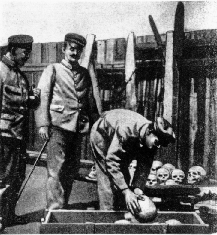
Tyske offiserer pakker ned hodeskaller i en eske for forsendelse til Berlin. Bildet viser sannsynligvis hodeskaller etter fanger fra namafolket, og er fra 1905/06.

Som direktør ved KWI ble Fischer i 1942 etterfulgt av sin gode venn og kollega Otmar Freiherr von Verschuer, som var aktivt medlem i NSDAP, og som førte raseforskningen videre med «materiale» som SS-legen Josef Mengele i Auschwitz leverte videre til KWI. Fischer slapp meget lett unna oppgjøret i 1945, og etter en rask «avnazifisering» ble han idømt en bot på 300 riksmark. 311 I 1952 ble Fischer æresmedlem av den tyske antropologiforeningen og kunne glede seg over at en lang rekke av hans medarbeidere og studenter fikk høye akademiske posisjoner i etterkrigstida. (Verschuer fortsatte som professor helt fram til 1965.) En annen av studentene ved KWI var Hendrik Verwoerd, som ble både en førende raseideolog og statsminister under det sørafrikanske apartheidregimet.