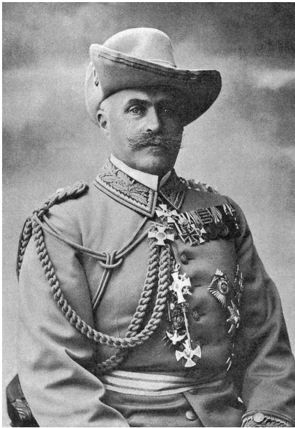
Lothar von Trotha (1848-1920) i sin koloniuniform med dekorasjoner.

Selv om Theodor Leutwein pro forma var koloniguvernør fram til slutten av november 1904, mottok von Trotha sine ordrer direkte fra keiser