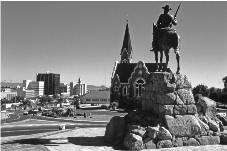
Det mest kjente krigsmonumentet er denne rytterstatuen, som ble avduket i januar 1912 for å ære tyske soldater. Ved siden av statuen ses Die Christuskirche som ble bygd med det samme formålet. Sammen har de en framtreddende plass i bybildet også i dagens Windhoek.

alle namibiske pengesedler, mens ingen tilsvarende ære er blitt Samuel Maharero til del. Dette står i kontrast til situasjonen i Tanzania, der både motstanden mot koloniseringen på 1890-tallet og Maji-Maji-krigen i 1905/06 har fått sine gatenavn, minnesmerker, monumenter, dikt og skuespill. 383