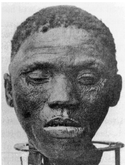
Avkappet hode fra tidligere fange i konsentrasjonsleiren på Shark Island