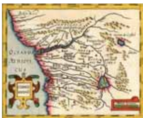
AFRIKA-KYSTEN: Kongos munning.

Å være «skeiv» er avkriminalisert i deler av Afrika, men mange steder fører det fortsatt til fengselsstraff. Det er i et slikt perspektiv interessant at flere nå kryttrer kong/dronning Njinga fra Ndongo (1583–1663) til skeiv historie. Det vises blant annet til at hun erklærte seg som ngola , en tittel som tradisjonelt var reservert for mannlige herskere. Hun (eller hen?) skal også ha iført seg mannsuniform når hun kjempet mot portugisiske inntrengere, og håndterte både hest og våpen «som en mann». Det er også kilder som forteller at hun hadde kvinnelige livvakter, og at hun omga seg med et slags harem av menn i kvinnekler. Det som i alle fall er klart, er at det var store variasjoner i kjønnsidentiter i det førkoloniale Afrika.