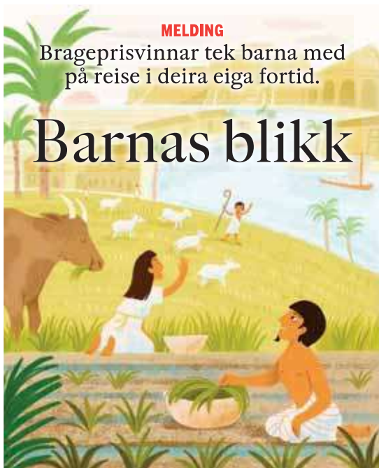
ILLUSTRASJON: VICTORIA SANDØY

og rytmiske setningar som kler godt tydelige og fargerike illustrasjonar. Med ordet til juryen: Fortida blir vekt til live både pedagogisk og poetisk. Det er ingen dårleg kombinasjon.